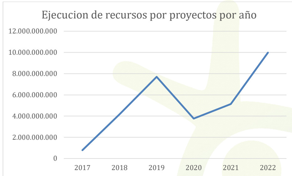
Crecimiento de inversiones en proyectos 1